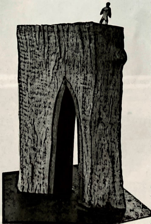
Auf dem Fels

Auftragsarbeiten des Künstlers – oft auch in Stein – entstanden so-